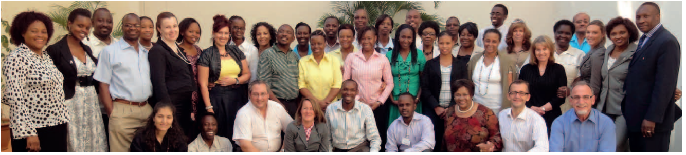
La red de ACCESS! en las regiones del COMESA y la SADC está preparada para prestar servicios de exportación a empresarias

El programa también ha inspirado a muchas mujeres africanas a formar sus propias asociaciones como medio de incrementar la producción y mejorar su potencial de exportación. Tras asistir a un curso de formación y a una reunión informativa sobre tutorías organizados por la Cámara de Asociaciones de Pequeñas y Medianas Empresas de Zambia en junio de 2011, diez empresarias acordaron unir fuerzas. El CPA se ofreció a prestar servicios de mediación para que las propuestas de negocio del consorcio se tengan debidamente en cuenta al solicitar financiación, así como asistencia para la planificación de empresas y exportación.