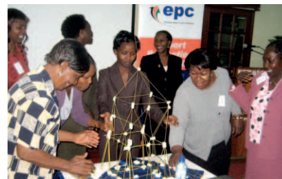
Ejercicio de creación de equipos en el taller nacional de formación organizado por el Consejo para la Promoción de las Exportaciones (Export Promotion Council - EPC) en Nairobi, Kenia