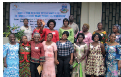
Empresarias liberianas en la inauguración de los talleres nacionales de formación de ACCESS! en Monrovia en julio de 2011