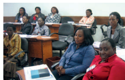
El Centro para el Desarrollo de Empresas de la Universidad Panafricana de Lagos es uno de los principales ejecutores del programa ACCESS! en Nigeria